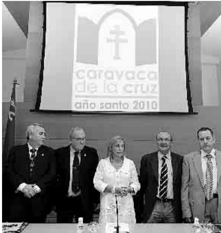
BAJO LA MISMA CRUZ. La consejera Reverte con los alcaldes de Abanilla, Caravaca, Granja de Rocamora y Ulea.

Tanto Aranda como Molina coincidieron en señalar que lo que